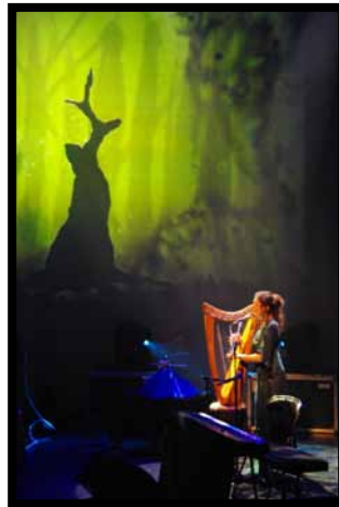
Wezen - Cesson-Sévigné (35) - 05/05/2012