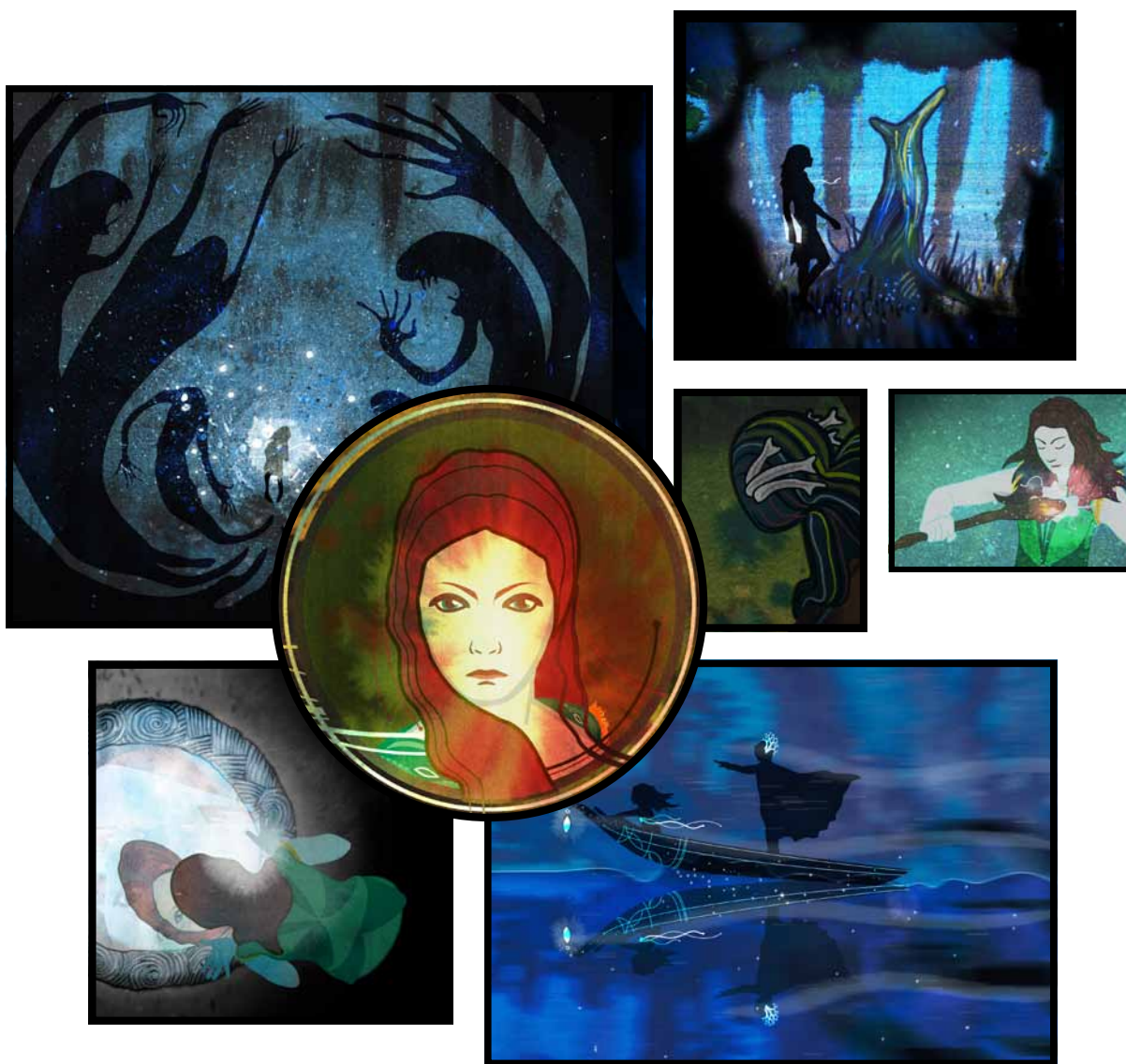
Illustrations extraites du livre Wezen

Va-t-elle grimper et découvrir enfin ce qui se cache par-delà la cime des arbres ?