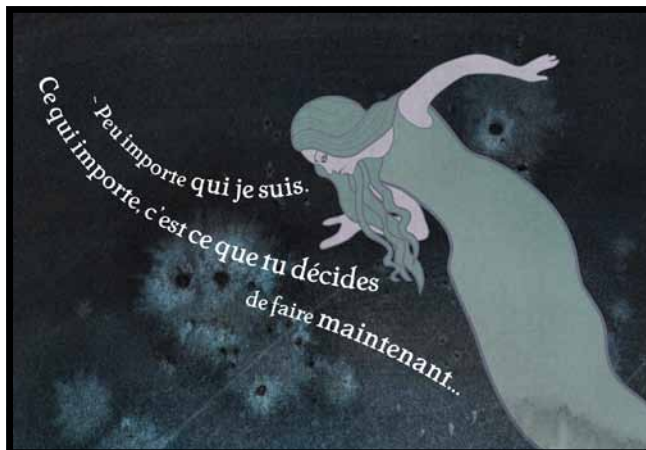
Illustrations extraites du livre Wezen

On y trouve des symboles et archétypes présents dans de nombreuses mythologies (personnages, nombres, lieux, parcours initiatiques), mais ceux-ci sont remodelés et agencés d'une manière nouvelle, de façon à mettre en relief leur caractère universel proprement mythique .